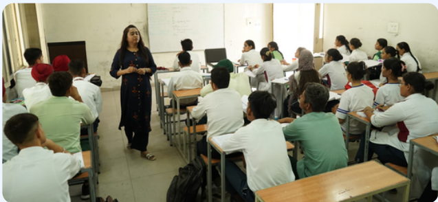
CLAT ਪ੍ਰੀਖਿਆ ਲਈ ਮਾਹਰ ਫੈਕਲਟੀ ਦੁਆਰਾ ਮੁਫਤ ਕੋਚਿੰਗ ਕਲਾਸਾਂ

PACE ਪ੍ਰੋਗਰਾਮ ਨੂੰ ਪੰਜਾਬ ਦੇ ਸਰਕਾਰੀ ਸਕੂਲਾਂ ਦੇ ਵਿਦਿਆਰਥੀਆਂ ਦੀ ਪ੍ਰਤਿਯੋਗੀ ਪ੍ਰੀਖਿਆਵਾਂ ਵਿੱਚ ਸਫਲਤਾ ਦਰ ਨੂੰ ਵਧਾਉਣ ਦੇ ਮਿਸ਼ਨ ਨਾਲ ਸ਼ੁਰੂ ਕੀਤਾ ਗਿਆ ਸੀ, ਤਾਂ ਜੋ ਉਹ ਭਾਰਤ ਅਤੇ ਵਿਦੇਸ਼ਾਂ ਵਿੱਚ ਪ੍ਰਸਿੱਧ ਪੇਸ਼ੇਵਰ ਸੰਸਥਾਵਾਂ ਵਿੱਚ ਦਾਖਲਾ ਲੈ ਸਕਣ। ਇਸ ਪ੍ਰੋਗਰਾਮ ਨੇ ਵਿਦਿਆਰਥੀਆਂ ਲਈ ਇਕ ਵਿਸ਼ੇਸ਼ਤਾਪੂਰਨ ਪਾਠਕ੍ਰਮ, ਸਮਰਪਿਤ ਡਾਊਟ ਕਲੀਅਰਿੰਗ ਸੈਸ਼ਨ, ਅਤੇ ਸੁਰੱਖਿਅਤ ਰਿਹਾਇਸ਼ੀ ਸਹੂਲਤਾਂ ਮੁਹੱਈਆ ਕਰਵਾਉਂਦਿਆਂ, ਪੰਜਾਬ ਦੇ ਸਿੱਖਿਆ ਦੇ ਨਤੀਜਿਆਂ ਦਾ ਮਿਆਰ ਉੱਚਾ ਚੁੱਕਣ ਅਤੇ ਵਿਦਿਆਰਥੀਆਂ ਨੂੰ ਸਰਵੋਤਮ ਸਮਰੱਥਾ ਹਾਸਲ ਕਰਨ ਵਿੱਚ ਮਦਦ ਕਰਨ ਦੀ ਵਚਨਬੱਧਤਾ ਨੂੰ ਪੂਰਾ ਕੀਤਾ। ਕੋਚਿੰਗ ਭਾਈਵਾਲਾਂ ਦੇ ਮਾਹਿਰ ਅਧਿਆਪਕਾਂ ਦੇ ਮਾਰਗਦਰਸ਼ਨ ਹੇਠ, ਵਿਦਿਆਰਥੀਆਂ ਨੇ ਪ੍ਰਵੇਸ਼ ਪ੍ਰੀਖਿਆਵਾਂ ਦੀ ਤਿਆਰੀ ਲਈ ਸਖਤ ਮਿਹਨਤ ਕੀਤੀ। ਪ੍ਰੀਖਿਆਵਾਂ ਨਾਲ ਜੁੜੇ ਤਣਾਅ ਨੂੰ ਸਮਝਦੇ ਹੋਏ, ਕੈਂਪ ਵਿੱਚ ਸਵੇਰੇ ਯੋਗਾ, ਸਰੀਰਕ ਟ੍ਰੇਨਿੰਗ ਕਲਾਸਾਂ ਅਤੇ ਸ਼ਾਮ ਦੀਆਂ ਖੇਡਾਂ ਵੀ ਸ਼ਾਮਲ ਕੀਤੀਆਂ ਗਈਆਂ, ਤਾਂ ਜੋ ਵਿਦਿਆਰਥੀ ਤਣਾਅ ਦਾ ਸਾਹਮਣਾ ਪ੍ਰਭਾਵੀ ਢੰਗ ਨਾਲ ਕਰ ਸਕਣ।