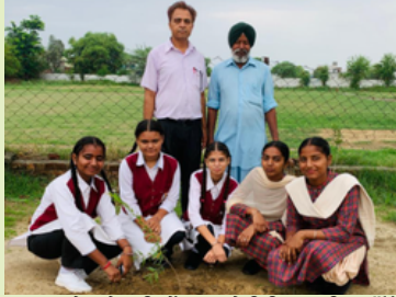
ਸਟਾਫ਼, ਐਸ.ਐਮ.ਸੀ. ਮੈਂਬਰਾਂ ਅਤੇ ਵਿਦਿਆਰਥੀਆਂ ਵੱਲੋਂ ਐਸ.ਓ.ਈ. ਸਮਾਣਾ ਵਿੱਚ ਰੁੱਖ ਲਗਾਏ ਜਾ ਰਹੇ ਹਨ

ਕੇਵਲ ਰੁੱਖ ਲਗਾਉਣ ਤੋਂ ਇਲਾਵਾ, ਇਹ ਮੁਹਿੰਮ ਅਧਿਆਪਕਾਂ ਅਤੇ ਵਿਦਿਆਰਥੀਆਂ ਨੂੰ ਇੱਕ ਨਵੀਂ ਰਚਨਾਤਮਕ ਮੁਹਿੰਮ ਵਿੱਚ ਵੀ ਸ਼ਾਮਲ ਕਰਦੀ ਹੈ ਜਿਸ ਵਿੱਚ ਵਿਦਿਆਰਥੀਆਂ ਅਤੇ ਅਧਿਆਪਕਾਂ ਨੇ ਪੌਦਿਆਂ ਨੂੰ ਗੋਦ ਲਿਆ ਹੈ ਅਤੇ ਉਨ੍ਹਾਂ ਦੇ ਨਾਂ ਰੱਖੇ ਹਨ ਜਿਸ ਨਾਲ ਵਾਤਾਵਰਣ ਪ੍ਰਤੀ ਜ਼ਿੰਮੇਵਾਰੀ ਅਤੇ ਸੰਜੀਦਗੀ ਦੀ ਭਾਵਨਾ ਪੈਦਾ ਹੁੰਦੀ ਹੈ।