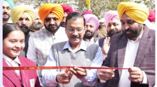
ਪੰਜਾਬ ਦੇ ਮੁੱਖ ਮੰਤਰੀ ਸ਼੍ਰੀ ਭਗਵੰਤ ਮਾਨ ਅਤੇ ਦਿੱਲੀ ਦੇ ਮੁੱਖ ਮੰਤਰੀ ਸ਼੍ਰੀ ਅਰਵਿੰਦ ਕੇਜਰੀਵਾਲ ਲੁਧਿਆਣਾ ਵਿਖੇ ਸਕੂਲ ਆਫ ਐਮੀਨੈਂਸ ਦਾ ਉਦਘਾਟਨ ਕਰਦੇ ਹੋਏ।

ਪੰਜਾਬ ਦੀ ਸਿੱਖਿਆ ਕ੍ਰਾਂਤੀ ਵਿੱਚ ਇਤਿਹਾਸਿਕ ਕਦਮ ਚੁੱਕਦਿਆਂ ਮੁੱਖ ਮੰਤਰੀ ਸ਼੍ਰੀ ਭਗਵੰਤ ਮਾਨ ਨੇ ਦਿੱਲੀ ਦੇ ਮੁੱਖ ਮੰਤਰੀ ਸ਼੍ਰੀ ਅਰਵਿੰਦ ਕੇਜਰੀਵਾਲ ਨਾਲ ਮਿਲ ਕੇ 13 ਸਕੂਲ ਆਫ ਐਮੀਨੈਂਸ ਦਾ ਉਦਘਾਟਨ ਕੀਤਾ-ਇਹ ਸਰਕਾਰੀ ਅਤੇ ਪ੍ਰਾਈਵੇਟ ਸਿੱਖਿਆ ਦੇ ਵਿਚਕਾਰ ਫਰਕ ਨੂੰ ਖ਼ਤਮ ਕਰਨ ਵੱਲ ਇੱਕ ਵੱਡੀ ਪਹਿਲਕਦਮੀ ਹੈ। ਸਾਰਾਗੜੀ ਮੈਮੋਰੀਅਲ ਸਕੂਲ ਆਫ ਐਮੀਨੈਂਸ ਟਾਊਨ ਹਾਲ, ਸਕੂਲ ਆਫ ਐਮੀਨੈਂਸ ਲੜਕੀਆਂ ਜੰਡਿਆਲਾ ਗੁਰੂ, ਸਕੂਲ ਆਫ ਐਮੀਨੈਂਸ ਲੜਕੀਆਂ ਮਾਲ ਰੋਡ ਸ਼੍ਰੀ ਅੰਮ੍ਰਿਤਸਰ ਸਾਹਿਬ, ਬਠਿੰਡੇ ਵਿੱਚ ਸਕੂਲ ਆਫ ਐਮੀਨੈਂਸ ਰਾਮਨਗਰ, ਸਕੂਲ ਆਫ ਐਮੀਨੈਂਸ ਪਰਸਰਾਮ ਨਗਰ, ਸ਼੍ਰੀ ਫਤਿਹਗੜ੍ਹ ਸਾਹਿਬ ਵਿੱਚ ਸਕੂਲ ਆਫ ਐਮੀਨੈਂਸ ਅਮਲੋਹ, ਫ਼ਾਜ਼ਿਲਕਾ ਵਿੱਚ ਸਕੂਲ ਆਫ ਐਮੀਨੈਂਸ ਅਰਨੀਵਾਲਾ ਸ਼ੇਖ ਸੁਭਾਨ, ਸਕੂਲ ਆਫ ਐਮੀਨੈਂਸ ਜਲਾਲਾਬਾਦ, ਜਲੰਧਰ ਵਿੱਚ ਸਕੂਲ ਆਫ ਐਮੀਨੈਂਸ ਆਦਮਪੁਰ, ਕਪੂਰਥਲਾ ਵਿੱਚ ਸਕੂਲ ਆਫ ਐਮੀਨੈਂਸ ਫਗਵਾੜਾ, ਲੁਧਿਆਣਾ ਵਿੱਚ ਸਕੂਲ ਆਫ ਐਮੀਨੈਂਸ ਸੈਕਟਰ 32, ਐੱਸਏਐੱਸ ਨਗਰ ਵਿੱਚ ਸਕੂਲ ਆਫ ਐਮੀਨੈਂਸ ਫੇਜ਼ 11 ਅਤੇ ਤਰਨਤਾਰਨ ਵਿੱਚ ਸਕੂਲ ਆਫ ਐਮੀਨੈਂਸ ਖੜੂਰ ਸਾਹਿਬ 3 ਮਾਰਚ, 2024 ਨੂੰ 13 ਨਵੇਂ ਸਕੂਲਾਂ ਦਾ ਉਦਘਾਟਨ ਕੀਤਾ ਗਿਆ। ਇਨ੍ਹਾਂ ਵਿੱਚੋਂ ਲੁਧਿਆਣਾ ਦੇ ਸੈਕਟਰ 32 ਵਿਖੇ ਸਕੂਲ ਆਫ ਐਮੀਨੈਂਸ ਨੇ ਸਭ ਤੋਂ ਪਹਿਲੇ ਸਰਕਾਰੀ ਸਕੂਲ ਦੇ ਤੌਰ ਤੇ ਆਪਣੀ ਸ਼ਾਨਦਾਰ ਪਛਾਣ ਬਣਾਈ ਹੈ। ਜਿੱਥੇ ਇੱਕ ਸਵਿਮਿੰਗ ਪੂਲ, ਬਾਸਕਟਬਾਲ ਕੋਰਟ ਅਤੇ ਟੈਨਿਸ ਕੋਰਟ ਦੀਆਂ ਸਹੂਲਤਾਂ ਦਿੱਤੀਆਂ ਗਈਆਂ ਹਨ। ਜੋ ਸਿੱਖਿਆ ਦੇ ਬੁਨਿਆਦੀ ਢਾਂਚੇ ਨੂੰ ਪੂਰੀ ਤਰ੍ਹਾਂ ਬਦਲਣ ਲਈ ਇਕ ਖ਼ਾਸ ਢੰਗ ਨਾਲ ਅੱਗੇ ਵਧ ਰਿਹਾ ਹੈ।