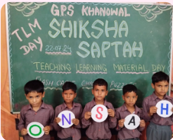
ਪ੍ਰਾਇਮਰੀ ਸਕੂਲ ਦੇ ਵਿਦਿਆਰਥੀ ਵੱਖ-ਵੱਖ ਸਰੋਤਾਂ ਰਾਹੀਂ ਸਿੱਖਦੇ ਹੋਏ

ਇਸ ਸਮਾਰੋਹ ਨੇ ਵਿਦਿਆਰਥੀਆਂ, ਅਧਿਆਪਕਾਂ, ਅਤੇ ਭਾਈਚਾਰੇ ਨੂੰ ਜੋੜਿਆ, ਸਿੱਖਿਆ ਵਿੱਚ ਸਹਿਯੋਗ ਅਤੇ ਨਵਾਚਾਰ ਦੀ ਭਾਵਨਾ ਨੂੰ ਮਜ਼ਬੂਤ ਕੀਤਾ। ਵਿਦਿਆਰਥੀਆਂ ਨੇ ਵੱਖ-ਵੱਖ ਗਤੀਵਿਧੀਆਂ ਅਤੇ ਮੁਕਾਬਲਿਆਂ ਵਿੱਚ ਭਾਗ ਲਿਆ।