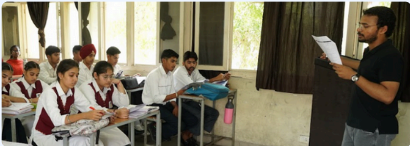
PACE ਕੈਂਪ ਦੌਰਾਨ ਕੋਚਿੰਗ ਪਾਰਟਨਰ ਕਲਾਸਾਂ ਲੈਂਦੇ ਹੋਏ

“ਸਕੂਲ ਦੌਰੇ ਦੌਰਾਨ ਇੱਕ ਮਾਤਾ-ਪਿਤਾ ਨੇ ਮਾਣ ਨਾਲ ਦੱਸਿਆ, “ਮੇਰੇ ਗੁਆਂਢੀ ਮੈਨੂੰ ਕਹਿੰਦੇ ਸਨ ਕਿ ਤੁਸੀਂ ਆਪਣੇ ਬੱਚਿਆਂ ਨੂੰ ਸਰਕਾਰੀ ਸਕੂਲ ਵਿੱਚ ਭੇਜ ਕੇ ਗਲਤੀ ਕਰ ਰਹੇ ਹੋ, ਅਤੇ ਮੈਨੂੰ ਮੇਰੇ ਫੈਸਲੇ 'ਤੇ ਸ਼ੱਕ ਵੀ ਸੀ, ਪਰ ਅੱਜ ਮੈਨੂੰ ਭਰੋਸਾ ਹੋ ਗਿਆ ਕਿ ਮੈਂ ਸਹੀ ਫੈਸਲਾ ਕੀਤਾ ਹੈ”।