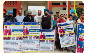
ਸਕੂਲ ਆਫ਼ ਐਮੀਨੈਂਸ ਵਿਦਿਆਰਥੀ ਦਾਖਲਾ ਮੁਹਿੰਮ ਵਿੱਚ ਹਿੱਸਾ ਲੈਂਦੇ ਹੋਏ ਐਸ.ਐਮ.ਸੀ. ਮੈਂਬਰ

ਇਹ ਸਾਂਝੀ ਕੋਸ਼ਿਸ਼ ਸਾਡੇ ਲੋਕਾਂ ਦੀ ਬੇਸ਼ਕੀਮਤੀ ਭਾਗੀਦਾਰੀ ਨੂੰ ਪ੍ਰਗਟਾਉਂਦੀ ਹੈ ਜੋ ਕਿ ਸਕੂਲ ਆਫ਼ ਐਮੀਨੈਂਸ ਪ੍ਰੋਗਰਾਮ ਦੀ ਸਫਲਤਾ ਅਤੇ ਵਿਕਾਸ ਨੂੰ ਯਕੀਨੀ ਬਣਾਉਣ ਵਿੱਚ ਸਹਾਇਕ ਹੈ ਤਾਂ ਜੋ ਵੱਧ ਤੋਂ ਵੱਧ ਬੱਚਿਆਂ ਨੂੰ ਇਸਦਾ ਲਾਭ ਮਿਲੇ। ਵਰਤਮਾਨ ਵਿੱਚ ਸਕੂਲ ਮੈਨੇਜਮੈਂਟ ਕਮੇਟੀਆਂ (SMCs) ਪੰਜਾਬ ਦੇ ਸਾਰੇ 19119 ਸਕੂਲਾਂ ਵਿੱਚ ਕਾਰਜਸ਼ਾਲੀ ਹਨ ਅਤੇ ਸਕਾਰਾਤਮਕ ਬਦਲਾਅ ਲਿਆਉਣ ਲਈ ਅਹਿਮ ਭੂਮਿਕਾ ਨਿਭਾ ਰਹੀਆਂ ਹਨ।