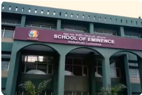
ਸਕੂਲ ਭਵਨ, ਐਸ.ਓ.ਈ. ਸੈਕਟਰ 32, ਲੁਧਿਆਣਾ

ਪੰਜਾਬ ਦੇ ਸਕੂਲ ਆਫ ਐਮੀਨੈਂਸ ਵਿੱਚ ਸਕੂਲ ਸਿੱਖਿਆ ਦੇ ਬੁਨਿਆਦੀ ਢਾਂਚੇ ਨੂੰ ਆਧੁਨਿਕ ਸਿੱਖਿਆ ਦੇ ਨਿਵੇਕਲੇ ਰੂਪ ਵਿੱਚ ਤਬਦੀਲ ਕੀਤਾ ਗਿਆ ਹੈ। ਇਹ ਬਦਲਾਅ ਨਾ ਸਿਰਫ ਪੰਜਾਬ ਵਿੱਚ ਸਰਕਾਰੀ ਸਿੱਖਿਆ ਦੇ ਮਿਆਰ ਨੂੰ ਉੱਚਾ ਚੁੱਕੇਗਾ ਸਗੋਂ ਸਰਕਾਰੀ ਸਕੂਲਾਂ ਵਿੱਚ ਪੜ੍ਹਨ ਲਈ ਵਿਦਿਆਰਥੀਆਂ ਦਾ ਭਰੋਸਾ ਹੋਰ ਮਜ਼ਬੂਤ ਕਰਨ ਵਿੱਚ ਵੀ ਸਹਾਈ ਸਿੱਧ ਹੋਵੇਗਾ।