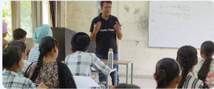
JEE ਅਤੇ NEET ਲਈ ਮਾਹਰ ਫੈਕਲਟੀ ਦੁਆਰਾ ਮੁਫਤ ਕੋਚਿੰਗ ਕਲਾਸਾਂ

ਸਕੂਲ ਸਿੱਖਿਆ ਵਿਭਾਗ ਵੱਲੋਂ ਕਰਵਾਏ ਗਏ ਇਸ ਸਰਵੇਖਣ ਅਨੁਸਾਰ ਇਸ ਪ੍ਰੋਗਰਾਮ ਦਾ ਡੂੰਘਾ ਅਸਰ ਪਿਆ ਅਤੇ 71% ਵਿਦਿਆਰਥੀ ਇਕ ਨਵੇਂ ਆਤਮ ਵਿਸ਼ਵਾਸ ਨਾਲ ਪ੍ਰੀਖਿਆਵਾਂ ਦਾ ਸਾਹਮਣਾ ਕਰਨ ਲਈ ਪ੍ਰੇਰਿਤ ਹੋਏ। ਵਿਦਿਆਰਥੀਆਂ ਦੀ ਪ੍ਰਗਤੀ ਦਾ ਮੁਲਾਂਕਣ ਕਰਨ ਲਈ ਉਹਨਾਂ ਦੇ ਸ਼ੁਰੂਆਤੀ ਅਤੇ ਆਖਿਰੀ ਕਲਾਸ ਇਮਤਿਹਾਨਾਂ ਦੇ ਨਤੀਜਿਆਂ ਨੂੰ ਅਧਾਰ ਬਣਾ ਕੇ ਪਰਖਿਆ ਗਿਆ, ਜੋ ਉਹਨਾਂ ਵਿੱਚ ਹੋਏ ਸ਼ਾਨਦਾਰ ਵਿਕਾਸ ਨੂੰ ਦਰਸਾਉਂਦੇ ਸਨ। ਕੋਚਿੰਗ ਕਲਾਸਾਂ ਤੋਂ ਇਲਾਵਾ ਉਸਾਰੂ ਨਜ਼ਰੀਆ ਵਿਕਸਿਤ ਕਰਨਾ, ਟੀਚਾ ਮਿਥਣਾ, ਅਤੇ ਸਮਾਂ ਪ੍ਰਬੰਧਨ 'ਤੇ ਵਰਕਸ਼ਾਪਾਂ ਦਾ ਆਯੋਜਨ ਕੀਤਾ ਗਿਆ।