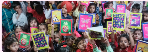
ਪ੍ਰਾਇਮਰੀ ਸਕੂਲ ਦੇ ਵਿਦਿਆਰਥੀ ਬੁਨਿਆਦੀ ਪੜ੍ਹਨ ਅਤੇ ਗਣਿਤ ਦੇ ਹੁਨਰਾਂ 'ਤੇ ਧਿਆਨ ਕੇਂਦਰਤ ਕਰਦੇ ਹੋਏ