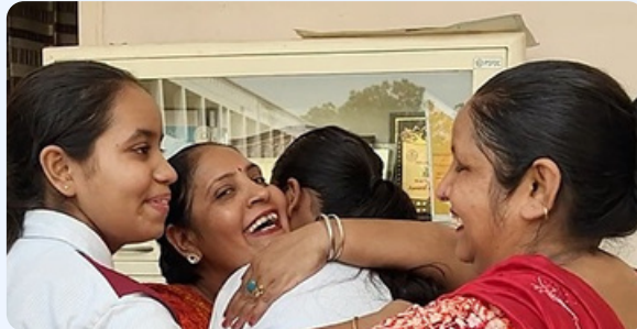
ਮਾਪਿਆਂ ਨੇ ਆਪਣੇ ਬੱਚਿਆਂ ਨੂੰ ਮਿਲਣ ਲਈ ਸਮਰ ਕੈਂਪ ਦਾ ਦੌਰਾ ਕੀਤਾ