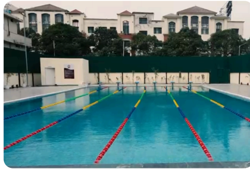
ਸਵਿਮਿੰਗ ਪੂਲ, ਐਸ.ਓ.ਈ. ਸੈਕਟਰ 32 ਲੁਧਿਆਣਾ