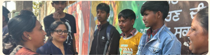
ਸਕੂਲ ਦਾਖਲਿਆਂ ਬਾਰੇ ਜਾਗਰੂਕਤਾ ਫੈਲਾਉਂਦੇ ਹੋਏ ਐਸ.ਐਮ.ਸੀ. ਮੈਂਬਰ

ਨੌਵੀਂ ਅਤੇ ਗਿਆਰਵੀਂ ਕਲਾਸ ਲਈ ਸਕੂਲ ਆਫ਼ ਐਮੀਨੈਂਸ ਅਤੇ ਮੈਰਿਟੋਰਿਅਸ ਸਕੂਲਾਂ ਵਿੱਚ ਦਾਖਲਾ ਪ੍ਰਕ੍ਰਿਆ ਖ਼ਤਮ ਹੋਣ ਦੇ ਲਾਗੇ ਅਤੇ ਸਕੂਲ ਮੈਨੇਜਮੈਂਟ ਕਮੇਟੀਆਂ (SMCs) ਵੱਲੋਂ ਸਮੁਦਾਏ ਨਾਲ ਰਲਕੇ ਸਕੂਲ ਆਫ਼ ਐਮੀਨੈਂਸ 'ਚ ਦਾਖਲੇ ਦੇ ਮੁਹਿੰਮ ਨੂੰ ਅੱਗੇ ਵਧਾਉਣ ਵਿੱਚ ਮਹੱਤਵਪੂਰਨ ਭੂਮਿਕਾ ਨਿਭਾਈ ਹੈ। ਸਕੂਲ ਸਿੱਖਿਆ ਵਿਭਾਗ ਵੱਲੋਂ ਹਾਲ ਹੀ ਵਿੱਚ ਕਰਵਾਏ ਗਏ ਸਰਵੇਖਣ ਅਨੁਸਾਰ ਐਸ.ਐਮ.ਸੀ (SMC) ਮੈਂਬਰਾਂ ਦੀ ਇਸ ਵਿੱਚ ਭਾਰੀ ਸ਼ਮੂਲੀਅਤ ਪਾਈ ਗਈ। 53% ਐਸ.ਐਮ.ਸੀ ਮੈਂਬਰਾਂ ਨੇ ਸਕੂਲ ਆਫ਼ ਐਮੀਨੈਂਸ ਦਾਖਲਾ ਮੁਹਿੰਮ ਵਿੱਚ ਸਰਗਰਮੀ ਨਾਲ ਹਿੱਸਾ ਲਿਆ ਉਹਨਾਂ ਨੇ ਗੈਰ ਸਕੂਲ ਆਫ਼ ਐਮੀਨੈਂਸ ਵਾਲੇ ਹੋਰਨਾਂ ਮਾਪਿਆਂ ਅਤੇ ਸਮੁਦਾਇਕ ਮੈਂਬਰਾਂ ਨਾਲ ਸੰਪਰਕ ਕਰਕੇ ਜਾਗਰੂਕਤਾ ਮੁਹਿੰਮ ਅਤੇ ਦਾਖਲੇ ਵਧਾਉਣ ਦੇ ਯਤਨ ਕੀਤੇ। ਕੁਝ ਮੈਂਬਰਾਂ ਨੇ ਮੁਹਿੰਮ ਦੇ ਪੋਸਟਰ ਬਣਾਉਣ, ਕਾਗਜ਼ੀ ਕਾਰਵਾਈ ਕਰਨ, ਕਾਉਂਸਲਿੰਗ ਦੁਆਰਾ ਸਮੁਦਾਇਕ ਐਲਾਨ ਕਰਨ ਅਤੇ ਪਹੁੰਚ ਨੂੰ ਵਧਾਉਣ ਵਿੱਚ ਯੋਗਦਾਨ ਪਾਇਆ।