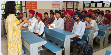
ਮੈਡੀਟੇਸ਼ਨ, ਕੈਰੀਅਰ ਹੰਟ ਆਦਿ ਵਰਗੀਆਂ ਗਤੀਵਿਧੀਆਂ ਵਿੱਚ ਸ਼ਾਮਲ ਵਿਦਿਆਰਥੀ