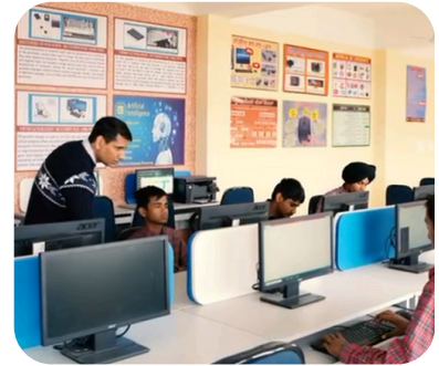
ਨਵ-ਨਿਰਮਿਤ ਕੰਪਿਊਟਰ ਲੈਬ, ਐਸ.ਓ.ਈ. ਸੈਕਟਰ 32 ਲੁਧਿਆਣਾ

ਅਸੀਂ ਪੰਜਾਬ ਦੇ ਸਕੂਲਾਂ ਦੀ ਕਾਇਆ ਕਲਪ ਕਰਨ ਦੇ ਆਪਣੇ ਨਜ਼ਰੀਏ ਨੂੰ ਸਾਂਝਾ ਕਰਦੇ ਹੋਏ ਉਤਸ਼ਾਹ ਨਾਲ ਭਰੇ ਹੋਏ ਹਾਂ, ਸਾਡਾ ਟੀਚਾ ਹਰ ਬੱਚੇ ਨੂੰ ਆਪਣੀ ਸਮਰੱਥਾ ਪਛਾਣਨ ਅਤੇ ਸਾਡੇ ਮਾਣਯੋਗ ਮੁੱਖ ਮੰਤਰੀ ਦੇ ਰੰਗਲਾ ਪੰਜਾਬ ਦੇ ਸੰਕਲਪ ਨੂੰ ਪੂਰਾ ਕਰਨਾ ਹੈ। ਗੁਣਵੱਤਾ ਪੂਰਨ ਸਿੱਖਿਆ ਸਾਡੀ ਸਿਖਰਲੀ ਤਰਜੀਹ ਰਹੇਗੀ, ਜੋ ਸਿਰਫ ਸਕੂਲ ਮੁਖੀਆਂ, ਅਧਿਆਪਕਾਂ, ਮਾਪਿਆਂ, ਸਮੁਦਾਇਕ ਮੈਂਬਰਾਂ ਅਤੇ ਹੋਰ ਹਿੱਸੇਦਾਰਾਂ ਦੇ ਸਹਿਯੋਗ ਨਾਲ ਹੀ ਹਾਸਲ ਕੀਤੀ ਜਾ ਸਕਦੀ ਹੈ। ਇਹ ਪੱਤ੍ਰਿਕਾ ਤੁਹਾਨੂੰ ਪੰਜਾਬ ਦੀਆਂ ਸਿੱਖਿਆ ਸੰਬੰਧੀ ਪਹਿਲਕਦਮੀਆਂ ਨਾਲ ਅਪਡੇਟ ਰੱਖੇਗੀ। ਆਓ ਮਿਲਕੇ ਪੰਜਾਬ ਦੇ ਸਕੂਲਾਂ ਵਿੱਚ ਆਪਣੇ ਬੱਚਿਆਂ ਦੇ ਭਵਿੱਖ ਨੂੰ ਰੋਸ਼ਨ ਬਣਾਈਏ।