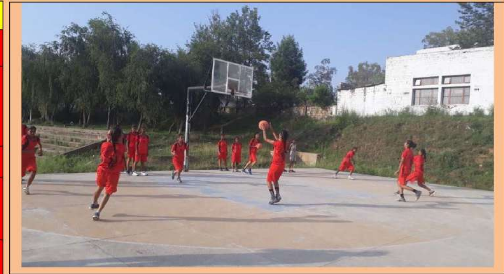
ਸਮਰ ਕੈਂਪ ਦੌਰਾਨ ਖੇਡਾਂ ਵਿੱਚ ਭਾਗ ਲੈਂਦੀਆਂ ਹੋਈਆਂ ਵਿਦਿਆਰਥਣਾਂ।

ਨੋਟ:- ਗਜ਼ਟਿਡ ਛੁੱਟੀਆਂ ਅਤੇ ਐਤਵਾਰ (ਲਾਲ ਰੰਗ ਵਿੱਚ)।