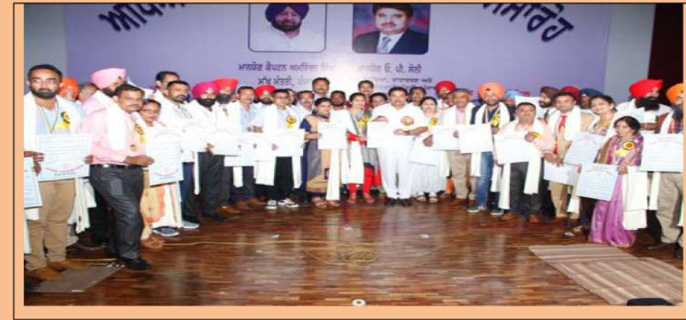
ਅਧਿਆਪਕ ਰਾਜ ਪੁਰਸਕਾਰ ਵੰਡ ਸਮਾਰੋਹ ਦੌਰਾਨ ਅਧਿਆਪਕਾਂ ਨੂੰ ਸਨਮਾਨਤ ਕਰਦੇ ਹੋਏ ਮਾਨਯੋਗ ਸਿੱਖਿਆ ਮੰਤਰੀ, ਪੰਜਾਬ।