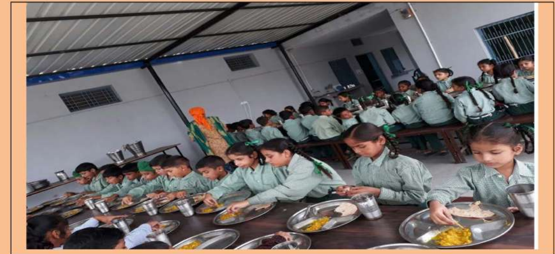
ਮਿਡ-ਡੇ-ਮੀਲ ਖਾਂਦੇ ਹੋਏ ਵਿਦਿਆਰਥੀ।