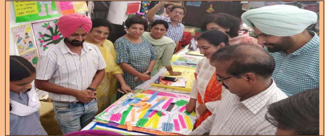
ਲੁਧਿਆਣਾ ਵਿਖੇ ਅੰਗਰੇਜ਼ੀ ਅਤੇ ਸਮਾਜਿਕ ਸਿੱਖਿਆ ਵਿਸ਼ੇ ਦੀ ਚਾਰਟ ਮੇਕਿੰਗ ਪ੍ਰਦਰਸ਼ਨੀ ਵੇਖਦੇ ਹੋਏ ਮਾਨਯੋਗ ਸਿੱਖਿਆ ਸਕੱਤਰ, ਪੰਜਾਬ।

ਸਕੂਲ ਦੀ ਗਾਈਡੈਂਸ ਕਮੇਟੀ ਵੱਲੋਂ ਵਿਦਿਆਰਥੀਆਂ ਅਤੇ ਮਾਪਿਆਂ ਦੀ ਸਹੂਲਤ ਲਈ ਸਥਾਈ ਕੈਰੀਅਰ ਕਾਊਂਸਲਿੰਗ ਹੈਲਪ ਡੈਸਕ ਲਗਾਉਣਾ ।