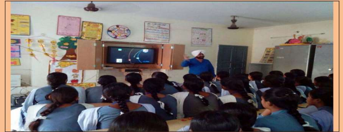
ਐਜੂਕੇਟ ਰਾਹੀਂ ਵਿਦਿਆਰਥੀਆਂ ਨੂੰ ਪੜ੍ਹਾਉਂਦੇ ਹੋਏ ਇੱਕ ਅਧਿਆਪਕ।

ਨੋਟ:- ਗਜ਼ਟਿਡ ਛੁੱਟੀਆਂ ਅਤੇ ਐਤਵਾਰ (ਲਾਲ ਰੰਗ ਵਿੱਚ)।