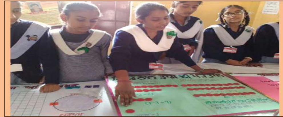
ਗਣਿਤ ਮੇਲੇ ਵਿੱਚ ਭਾਗ ਲੈਂਦੀਆਂ ਹੋਈਆਂ ਵਿਦਿਆਰਥਣਾਂ।