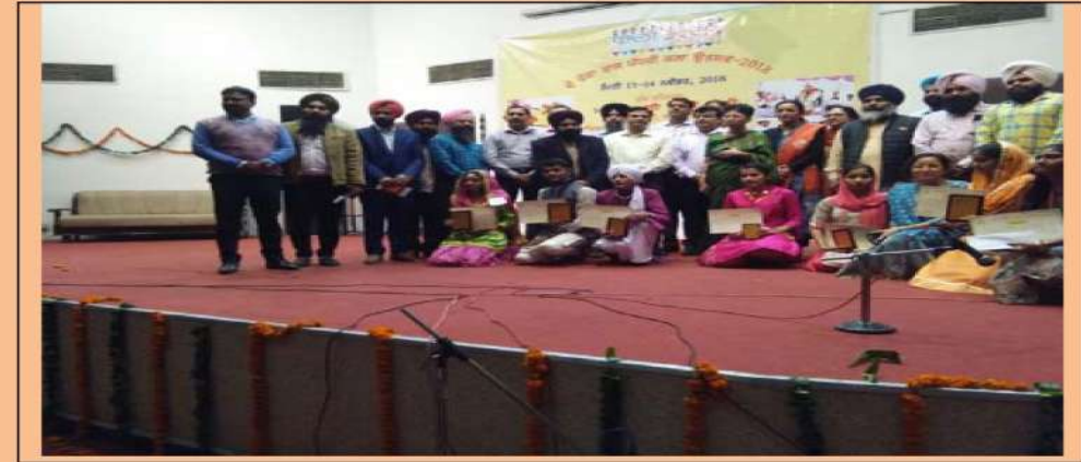
ਰਾਜ ਪੱਧਰੀ ਕਲਾ ਉਤਸਵ ਮੌਕੇ ਜੇਤੂ ਵਿਦਿਆਰਥੀਆਂ ਨੂੰ ਇਨਾਮ ਦਿੰਦੇ ਹੋਏ ਮਾਨਯੋਗ ਡਾਇਰੈਕਟਰ ਜਨਰਲ ਸਕੂਲ ਸਿੱਖਿਆ, ਪੰਜਾਬ।