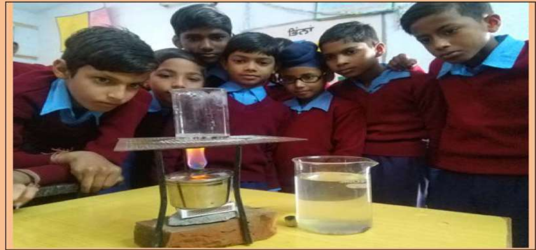
ਆਪਣੇ ਹੱਥੀਂ ਸਾਇੰਸ ਵਿਸ਼ੇ ਦੀ ਕਿਰਿਆਵਾਂ ਕਰਦੇ ਹੋਏ ਵਿਦਿਆਰਥੀ।