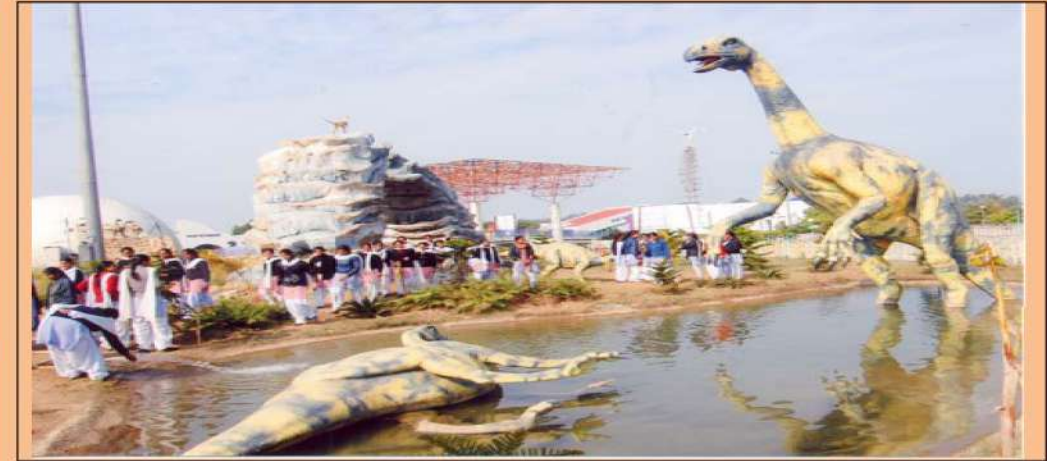
ਵਿਗਿਆਨ ਯਾਤਰਾ ਅਧੀਨ ਕਰਵਾਈ ਜਾ ਰਹੀ ਪੁਸ਼ਪਾ ਗੁਜਰਾਲ ਸਾਇੰਸ ਸਿਟੀ, ਕਪੂਰਥਲਾ ਦੀ ਵਿਜ਼ਿਟ ਦੌਰਾਨ ਪਾਰਕ ਦੇਖਦੇ ਹੋਏ ਵਿਦਿਆਰਥੀ।

ਨੋਟ:- ਗਜ਼ਟਿਡ ਛੁੱਟੀਆਂ ਅਤੇ ਐਤਵਾਰ (ਲਾਲ ਰੰਗ ਵਿੱਚ)।