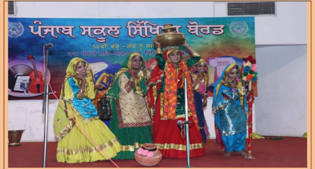
ਰਾਜ ਪੱਧਰੀ ਸਹਿ-ਅਕਾਦਮਿਕ ਵਿੱਦਿਅਕ ਮੁਕਾਬਲੇ ਵਿੱਚ ਭਾਗ ਲੈਂਦਿਆਂ ਹੋਈਆਂ ਵਿਦਿਆਰਥਣਾਂ।

ਮੈਥ ਡੇ ਮਨਾਉਣਾ (22 ਦਸੰਬਰ, ਮਹਾਨ ਗਣਿਤਕਾਰ ਸ਼੍ਰੀ ਨਿਵਾਸਾਰਾਮਾਨੁਜਮ ਦੇ ਜਨਮ ਦਿਨ ਮੌਕੇ)।